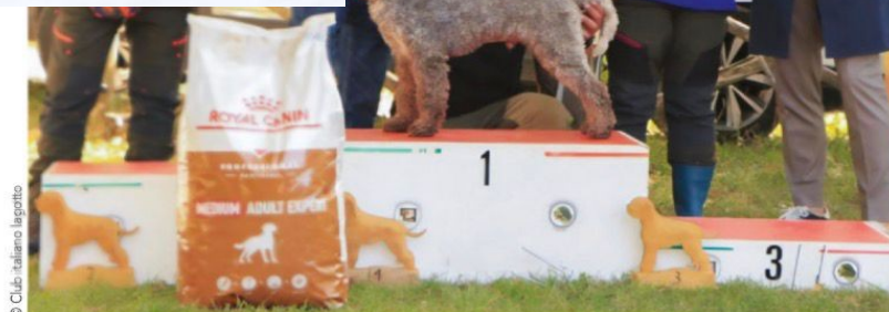
Falco, vainqueur du trophée Quentino-Toschi 2025.

une compétition de troupeau « traditional style », c'est-à-dire ouverte à toutes les races de chiens de berger à l'exception du border collie, qui se tiendra à Monceau-le-Neuf-et-Faucouzy (Aisne) du 22 au 24 mai et réunira trente équipes sélectionnées dans une douzaine de pays européens. Le second se déroulera du 24 au 26 juillet au Grand parcquet de Fontainebleau (Seine-et-Marne), et rassemblera plus de 800 chiens issus de sélections nationales de tous les continents. Deux occasions